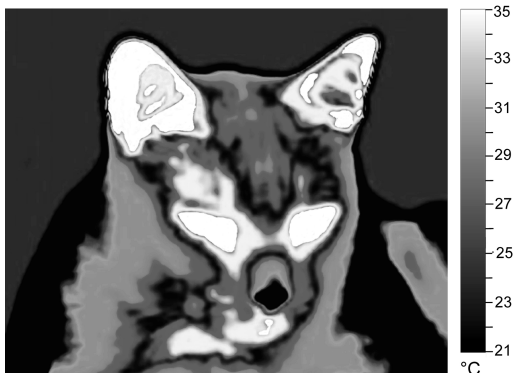
Wärmestrahlung Katze (Bild: foto-technik Dieter Schüßler).

Alle Gegenstände senden Wärmestrahlung aus. Die Abbildung zeigt eine Katze, die mit einer Wärmebildkamera aufgenommen wurde. Dabei wird die Wärmestrahlung von der Kamera erfasst und normalerweise durch verschiedene Farben als Wärmebild dargestellt. Jede Farbe entspricht einer bestimmten Temperatur. Hier wurden die Farben nachträglich in Graustufen verwandelt. Man sieht, dass