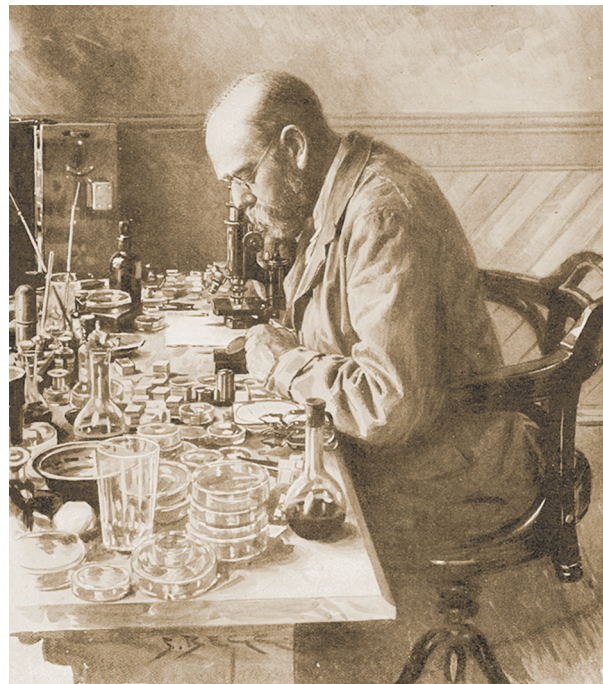
Abb. 3 Robert Koch, Begründer der modernen Mikrobiologie, beim Färben von Bakterien mit Anilinfarben.

Das hat sich erst in den letzten Jahren gewandelt, seitdem die Biochemie die Struktur der Rezeptoren ermitteln kann. Das rationale „drug design“ rückt in greifbare Nähe (Abb. 4). Wer jedoch genauer hinschaut, wird erkennen, dass der Effekt von Serendipity (der glückliche, unvorhergesehene Glücksfall) immer noch eine Rolle spielt. In diesen Zusammenhang passt der Hinweis, dass z. B. alle, wirklich alle im Handel befindlichen Süßstoffe durch Zufall entdeckt wurden. Vielleicht lohnt es doch, jede neue Substanz auf der Zungenspitze zu testen.