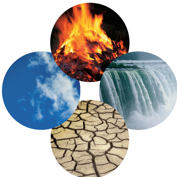
Abb. 1 Das Weltbild des Empedokles (er lebte zwischen 485 und 420 v. Chr. – die genauen Daten sind nicht bekannt): die vier Elemente Erde, Wasser, Luft und Feuer.

Dieser Wissensstand währte über 2300 Jahre. Die Alchemie des Mittelalters brachte zwar zahlreiche Einzelerkenntnisse zuwege, aber die Fülle verwirrte mehr als sie Ordnung brachte. Erst die mit der Aufklärung beginnenden systematischen Experimente mit dem Gebot der Reproduzierbarkeit trennten Spekulation von gesichertem Wissen. Dennoch war es ein mühsamer, steiniger Weg, auf dem es nur langsam vor-