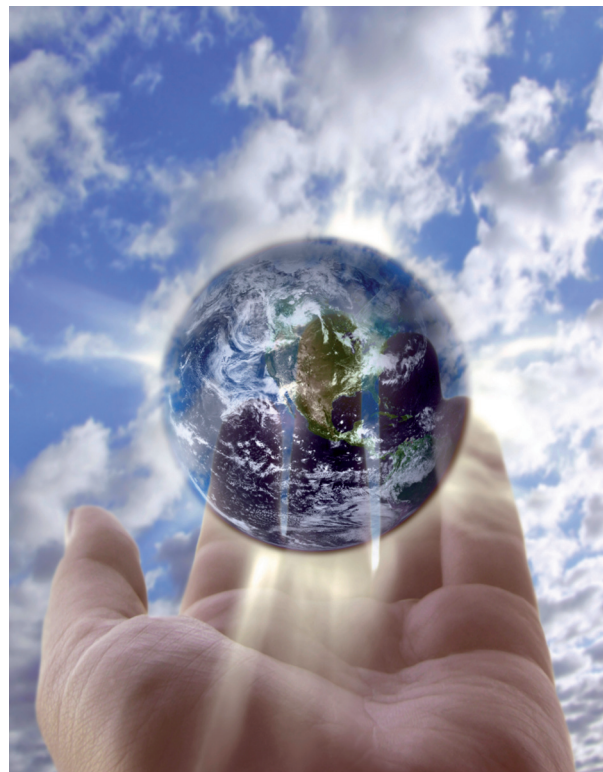
Abb. 8 Die Menschheit muss mit den Ressourcen des Planeten Erde sparsam und nachhaltig umgehen.

Das ist auch notwendig, denn neben den alten Herausforderungen an die Chemie, wie z. B. die Versorgung mit Nahrungsmitteln (Düngemittel, Pflanzenschutz) und die Bereitstellung von neuen Materialien (Kunststoffe, Legierungen)