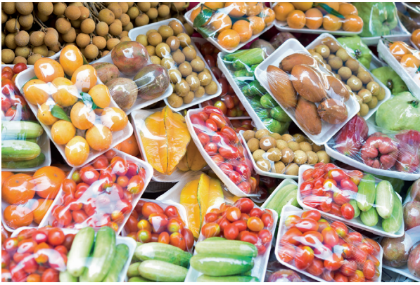
Abb. 6 Ohne Kunststoffverpackungen gäbe es keine Selbstbedienung.