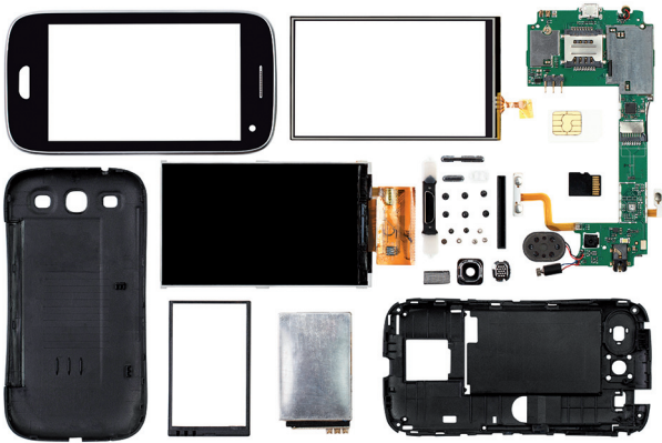
Abb. 7 In jedem Smartphone finden sich über 30 Elemente – mehr als in unserem Körper (27 Elemente).

restlichen 0,4 % teilen sich insgesamt noch 22 Spurenelemente. Die Zahl ist erstaunlich gering, wenn man bedenkt, dass ein im Vergleich zu einem lebenden Organismus primitives Gerät wie ein Smartphone weit über 30 Elemente enthält (Abb. 7). Warum sich die Evolution auf so wenige Elemente beschränkte, wird auch die Chemie in der Zukunft beschäftigen. Dahinter versteckt sich nämlich die Frage, ob unsere Lebensform die einzige ist, die das Periodensystem zulässt. Ist ihm oder den Elementen überhaupt anzusehen, dass die Möglichkeit zur Entwicklung von Leben in ihnen steckt? Kohlenstoff wird wegen seiner Vielseitigkeit wohl unverzichtbar sein. Was ist aber sonst noch notwendig? Warum sind so allgegenwärtige Elemente wie Aluminium und Silicium unberücksichtigt geblieben? Könnte es Leben geben, in dem diese leicht verfügbaren Elemente eine Rolle, vielleicht sogar eine wichtige Rolle spielen?