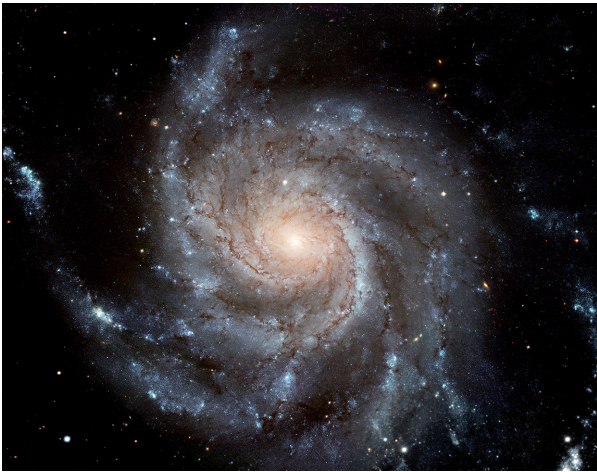
Abb. 2 Das Periodensystem der Elemente gilt für das gesamte Universum.

die Eigenschaften der Elemente und ihrer Verbindungen. Das Periodensystem lieferte zwar wertvolle Hinweise, aber eben nur Hinweise. Es bestätigte sich immer mehr: Jedes Element ist ein Individuum mit ganz charakteristischen Eigenheiten. Man sieht es den jeweiligen Atomen nicht an, was in ihnen steckt. Erst in den Verbindungen mit anderen Elementen geben sie ihre Geheimnisse preis. Das ist Last und Chance zugleich. Verallgemeinernde Regeln lassen keine sicheren Prognosen zu. Alle Vermutungen müssen experimentell überprüft werden. Dabei besteht die Chance, neue, abweichende Eigenschaften zu entdecken. Diese können von großem Nutzen sein, wie gleich erläutert wird.