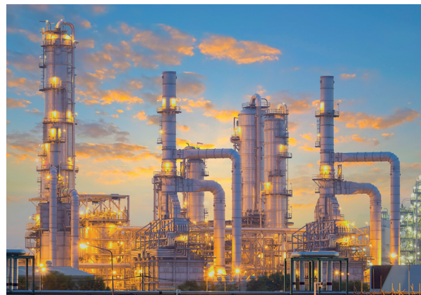
Abb. 5 Die meisten Chemieprodukte werden aus Erdöl hergestellt, das in Raffinerien aufgearbeitet wird.

Was und wie viel sonst noch braucht ein Lebewesen neben dem Kohlenstoff aus dem Baukasten Periodensystem? Auffallend ist zunächst eine extrem ungleiche Verteilung. Wasserstoff, Sauerstoff und Kohlenstoff machen 98 % aus, mit Stickstoff und Calcium kommen noch 1,6 % hinzu. Die