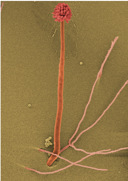
Abb. 1.2 Aspergillus niger auf Agarplatte, REM-Aufnahme.