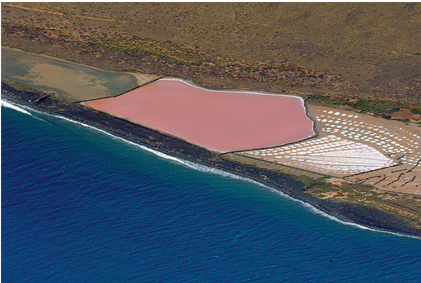
Abb. 1.4 Halobakterien färben eine Saline auf Lanzarote rot.