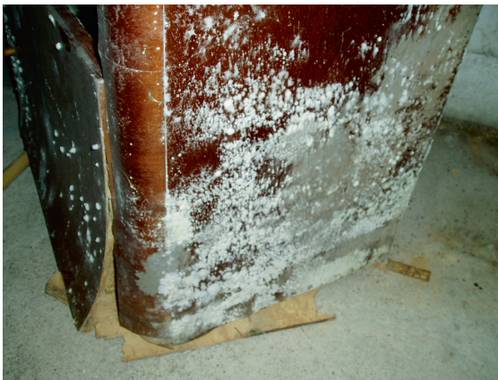
Abb. 1.1 Weiße Schimmelpilze auf feuchtem Möbelholz im Keller, nach einem Eindringen von Regenwasser.

Pilze ( Mycobionta , Fungi ) sind eine sehr heterogene Gruppe in vielen Formen und Farben ubiquitär vorkommender eukaryontischer Lebewesen mit mehr als 110 000 Arten; sie lassen sich in vier Gruppen einteilen: Ständerpilze (Basidiomycota) mit ca. 30 000 Spezies, Schlauchpilze (Ascomycota) mit ca. 46 000 Spezies (darunter ca. 1000 Arten von Hefen oder Endomycetes), Jochpilze (Zygomycota) mit ca. 650 Spezies und Fungi imperfecti (oder Deuteromycota) mit ca. 30 000 Spezies. Nahezu alle human- und tierpathogenen Pilze sowie die meisten Schimmelpilze gehören in diese letzte Gruppe [13]. Aus Pilzen besteht schätzungsweise 25 % der Biomasse unserer Erde. Pilze können sogar optische Linsen in Objektiven besiedeln. Ungefähr 300 Arten sind humanpathogen [9], jedoch gehen die meisten Erkrankungen von Kulturpflanzen auf Pilze zurück. Pilze können Toxine produzieren (bisher sind mehr als 500 Mykotoxine bekannt), die für Mensch und Tier zum Teil letal sind (in Deutschland sterben jährlich ca. 50 Menschen an den Folgen von Pilzvergiftungen). Außerdem können toxische und kanzerogene Stoffwechselprodukte, vor allem von Schimmelpilzen, produziert werden: Aflatoxine, Ochratoxine, Patuline, Fusariumtoxine. Die Food and Agricultural Organization