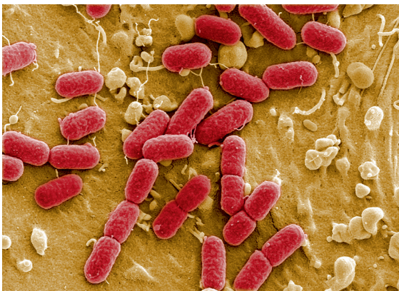
Abb. 1.5 EHEC O157-H7 auf Fibroblast. REM-Aufnahme, Vergrößerung 40 000×.

EAEC: enteroaggregative Escherichia coli ; DAEC: diffus adhärente Escherichia coli ; STEC: shigatoxinbildende Escherichia coli ; VTEC: verotoxinbildende Escherichia coli ; EIEC: enteroinvasive Escherichia coli ; EPEC: enteropathogene Escherichia coli ; ETEC: enterotoxische Escherichia coli ; EHEC: enterohämorrhagische Escherichia coli ; HUS: hämolytisches Urämiesyndrom.