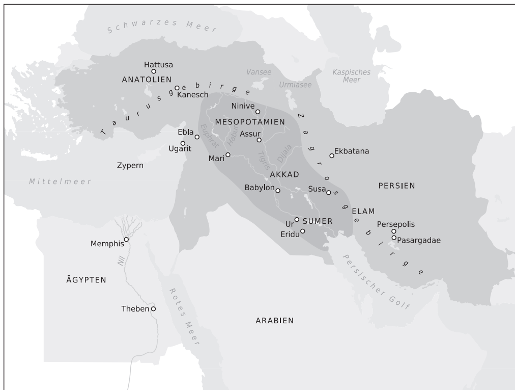
Abbildung 1.2: Gesamtüberblick über den Alten Orient

Das Ende aller orientalischen Vorherrschaft leiteten die Perser mit ihrer Dynastie der Achämeniden ein. (Eine Übersicht über die Völker und ihre Regionen finden Sie in Abbildung 1.2 sowie auch in Kapitel 19.)