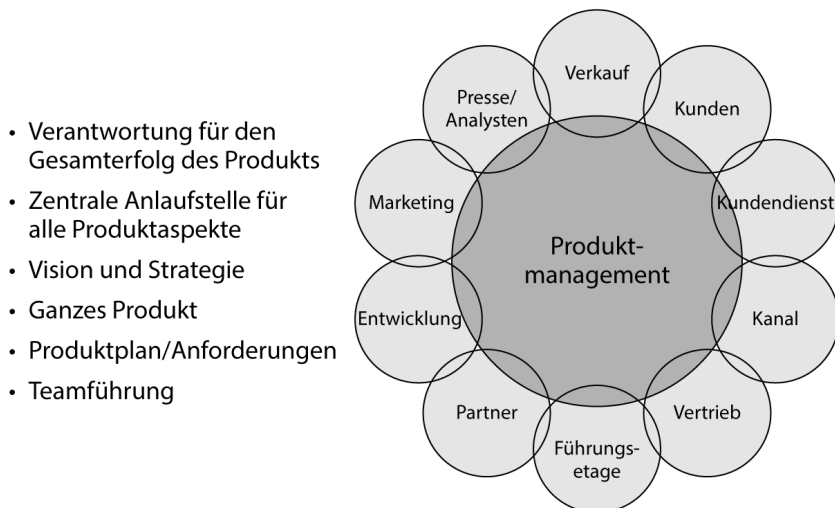
Abbildung 1.1: Die Rolle des Produktmanagements; © 2017, 280 Group LLC.

Produktmanagement: Der Schwarze Peter bleibt bei Ihnen