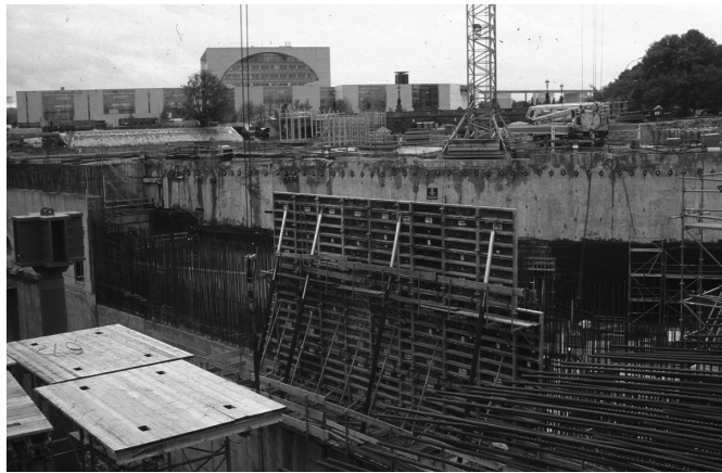
Abb. 1.2 Verankerte Baugrubenwand in Berlin.

Ramm- und Bohrarbeiten mit schwerem Gerät zur Einbringung von Verbauträgern von der Geländeoberfläche aus wurden überflüssig, wenn die Baugrundverhältnisse den Einsatz des neuen Verfahrens ermöglichten. Auch bei der Bodenvernagelung geht es darum, Zugkräfte in den Baugrund einzuleiten.