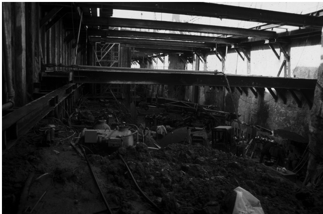
Abb. 1.1 Ausgesteifte Baugrube.

Mit der Entwicklung des Bauverfahrens Bodenvernagelung vor etwa 40 Jahren wurde es möglich, Baugruben auszuheben und die Sicherung der Baugrubenwände mit Spritzbeton und Zuggliedern aus Baustahl während des Aushubs vorzunehmen.