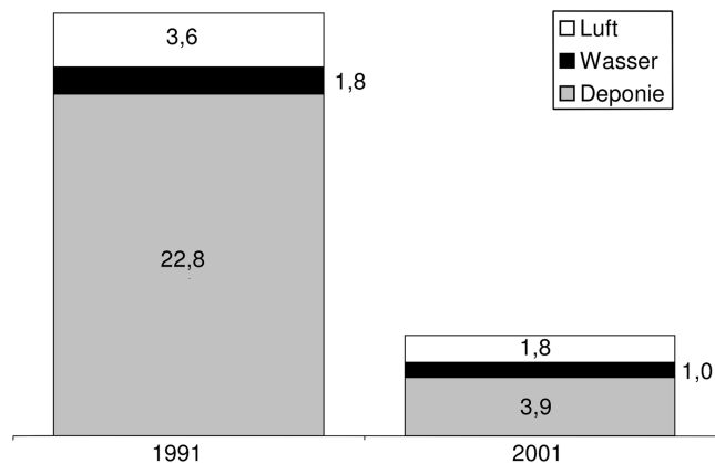
Abb. 1.1 Produktionsspezifische Umweltbelastung in kg je Tonne Verkaufsprodukt der BASF AG für 1991 und 2001.

Bis heute besteht ein großes Interesse an der Senkung von produktionsbedingten Emissionen. In dem Zeitraum zwischen 2002 und 2009 konnten nach einem Jahresbericht