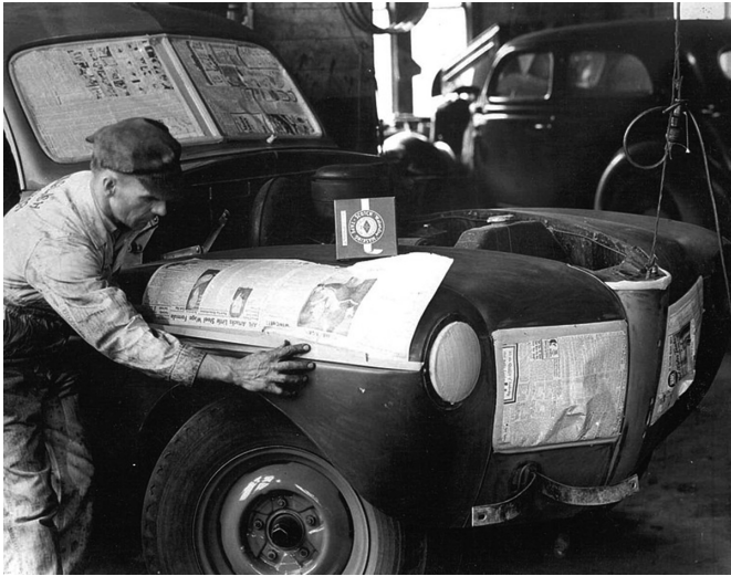
Abb. 1.3 Die erste Anwendung von Scotch-Abdeckklebebandern (Foto: 3M).