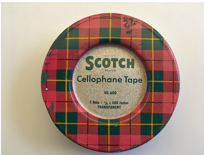
Abb. 1.4 Dose mit „Scotch Cellophane Tape“ aus den 1950er-Jahren.