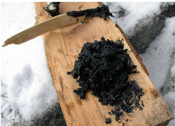
Abb. 1.1 Im Eintopfverfahren hergestelltes Birkenpech.

Bereits vor dieser Zeit, etwa 4000 Jahre vor Christus, wurde von den Sumerern ein Klebstoff entwickelt und hergestellt. Hierbei handelte es sich um eine Art Glutinleim aus Tierhäuten, Segin genannt, den sie beim Bau ihrer Häuser und