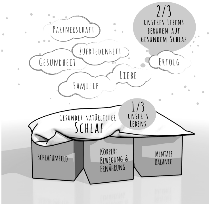
Abbildung 1.2: Das Grundprinzip der ENS-Methode

Die einzelnen Säulen der ENS-Methode stehen dabei für das Schlafumfeld, den Gesamtstatus des Körpers und die mentale Balance.