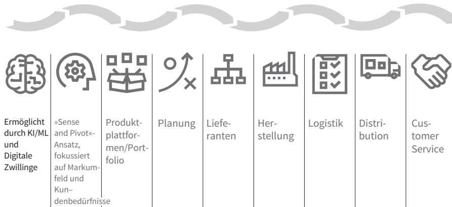
Abbildung 1.1: Eine ganzheitliche Wertschöpfungskette umfasst Operations und Lieferketten.

Die Definition von Operations Management beziehungsweise Operations und Supply Chain mag auf der Hand liegen; hier aber geht es zunächst darum, ihre Beziehungen innerhalb der gesamten Wertschöpfungskette in den Blick zu nehmen (siehe Abbildung 1.1). Ausgangspunkt ist der Wunsch Ihres Unternehmens, etwas zu verkaufen und sich in den jeweiligen Märkten zu positionieren. Sie entwickeln Produkte und Produktportfolios und planen die einzelnen Schritte im Fertigungsprozess. Sie finden Lieferanten, die Ihre Produktionsstätten mit den erforderlichen Inputs für die Herstellung versorgen, und im Anschluss übernehmen Ihre Logistikfunktionen die Zustellung der Endprodukte an Ihre Kundinnen und Kunden. Im Idealfall bieten Sie im Anschluss einen Customer Service, mit dem Sie die Kundenbeziehung auf- und ausbauen. Im engeren Sinn könnte die Supply Chain auf die beiden mittleren Teile der Abbildung beschränkt sein: Lieferanten und Herstellung. Doch de facto sind sie, genau wie alle anderen Unternehmensaktivitäten, die in den Prozess einfließen, Teil einer ganzheitlichen Wertschöpfungskette . Durch den Aufbau einer starken, agilen Supply Chain wird jeder Schritt in diesem Wertschöpfungsprozess resilienter. Sie sollten also nicht nur den Kosten und der Performance, sondern auch der Reaktionsfähigkeit der gesamten Wertschöpfungskette Priorität einräumen.