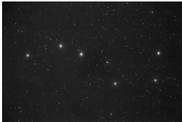
Abbildung 1.1: Ein Foto des Großen Wagens

Professionelle Astronomen untersuchen die Sonne, das Sonnensystem, unsere Heimatgalaxis, die Milchstraße, und die Weiten des dahinter liegenden Universums. Sie lehren an Universitäten, entwerfen Satelliten und arbeiten in Planetarien. Manchmal schreiben sie Bücher, so wie dieses. Viele führen einen Dokortitel. Andere wiederum studieren die komplizierteste Physik und arbeiten mit vollautomatischen Teleskopen. Oft kennen sie vielleicht noch nicht einmal mehr die Sternbilder – das sind Gruppen von Sternen, die von antiken Sternbeobachtern erfunden wurden, wie z. B. Ursa Major , der Große Bär, und die in den meisten astronomischen Einführungskursen vorkommen. Wahrscheinlich kennen Sie den »Großen Wagen«, ein Asterismus in Ursa Major. Ein Asterismus ist eine Sternfigur, die sich nicht unter den 88 anerkannten Sternbildern befindet. Abbildung 1.1 zeigt den Großen Wagen am Nachthimmel.