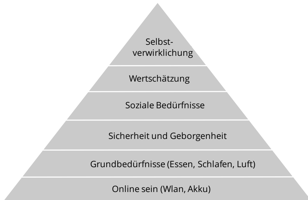
Abbildung 1.2: Erweiterte Maslowsche Bedürfnispyramide

Einige Ökonomen behaupten heute, dass die gute alte Maslowsche Bedürfnispyramide aus dem Jahr 1954 nicht mehr auf die heutige Zeit zutrifft. Wenn Sie allerdings daran denken, wie Sie in einer durchzechten Nacht in einer Disco noch ein paar Stunden zuvor nach Selbstverwirklichung gestrebt haben und dann gegen Morgengrauen hungrig, durstig und müde nach Hause fahren, so sind Sie wieder in der ersten Stufe der Pyramide angekommen. Sie wollen und können nur die nächste Stufe Ihrer Pyramide erreichen, wenn Sie die Stufe davor erfolgreich gemeistert haben. In dem Fall: nur noch schlafen und duschen. Und andere plädieren eventuell noch dafür, zumindest WLAN und das Akkuladegerät auf die Ebene der Grundbedürfnisse zu platzieren. Die erweiterte Maslowsche Bedürfnispyramide ist daher in Abbildung 1.2 mit einem Augenzwinkern skizziert.