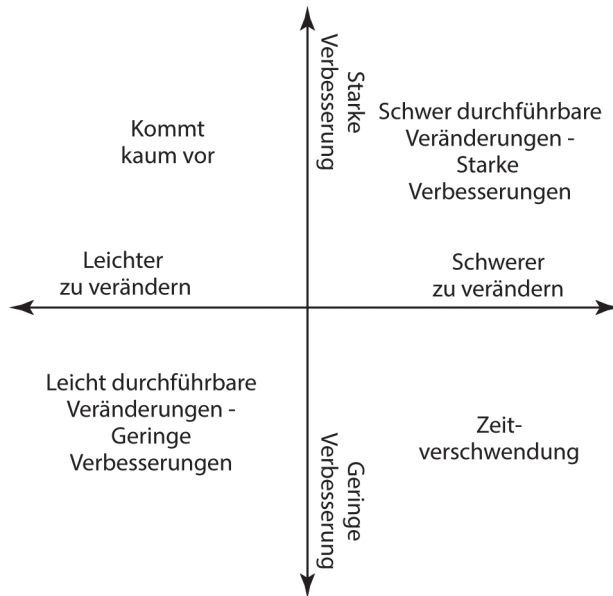
Abbildung 1.1: Der optimale Bereich für Veränderungen

Sobald Sie diesen Bereich gefunden haben (und die Bereiche, die auf der einen oder anderen Seite danebenliegen), sind Sie so weit, mit der Übernahme der gewählten agilen Rahmenstrukturen, Prozesse und Prinzipien zu beginnen.