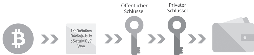
Abbildung 1.4: Ohne privaten Schlüssel kommen Sie an Ihre Kryptowährung nicht mehr heran!

Die Regelung des Zugriffs auf die Adresse über den Private Key ist ein ganz entscheidendes Konzept von Kryptowährungen, das Menschen, die den Zugriff auf ihre Kryptowährung verlieren oder deren Kryptowährung gestohlen wird, oftmals nicht verstehen (siehe Abbildung 1.4). Die Kryptowährung ist einer Blockchain-Adresse zugeordnet; die Adresse wird vom öffentlichen Schlüssel abgeleitet, der zu einem privaten Schlüssel gehört, der in einer Wallet sicher verwahrt wird. In diesem Buch werden wir nicht im Detail auf die Absicherung von privaten Schlüsseln eingehen. Aber Sie sollten sicherstellen, dass Sie Ihre privaten Schlüssel schützen! Verlieren Sie sie nicht und achten Sie darauf, dass andere Menschen sie niemals erfahren!