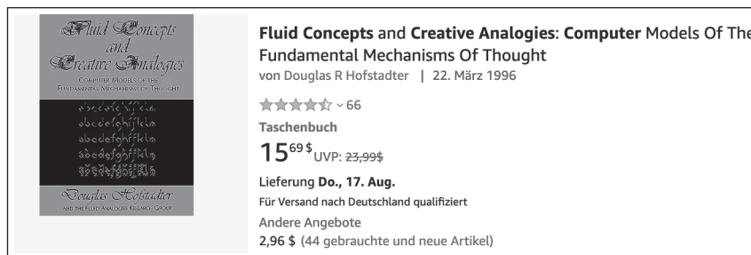
Abbildung 1.1: Buch Fluid Concepts and Creative Analogies auf Amazon

Das erste Buch, das einst über die virtuelle Ladentheke bei Amazon ging, trug den Titel »Fluid Concepts and Creative Analogies«. Der Käufer besitzt das Buch immer noch, sogar mit Originalverpackung. Auch heute kann man das Buch noch auf Amazon erwerben (siehe Abbildung 1.1).