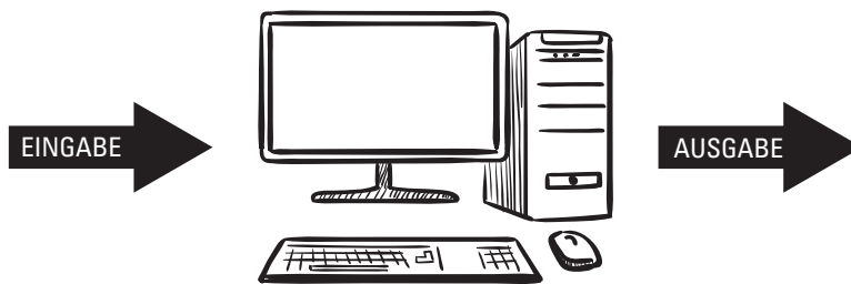
Abbildung 1.2: Was ein Computer tut – ganz simpel dargestellt

Ein Computer nimmt Daten auf, verarbeitet sie und gibt sie dann wieder aus. Das ist das ganze Prinzip, aber damit Sie nicht vollkommen verwirrt werden, werfen Sie einen Blick auf Abbildung 1.2, die dieses grundlegende Computerkonzept darstellt.