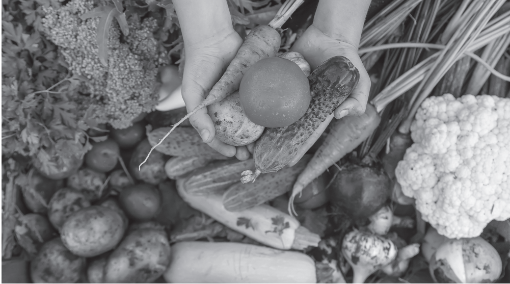
Abbildung 1.1: Beispiele lebergesunder Nahrungsmittel aus der mediterranen Kost