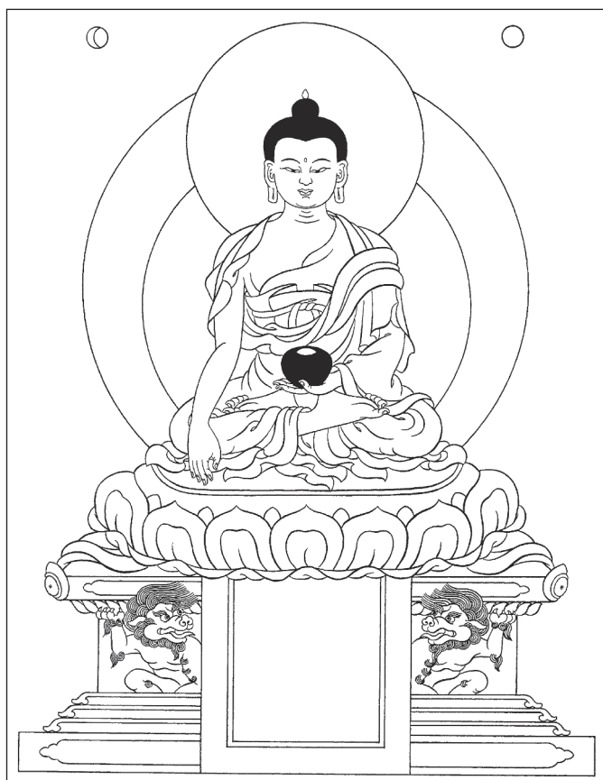
Abbildung 1.1: Shakyamuni Buddha

Schließlich erreichte Prinz Siddhartha im Alter von 35 Jahren sein Ziel. Als er unter einem Baum saß, der später als der Bodhi-Baum – der Baum der Erleuchtung – bekannt wurde, erlangte er das vollkommene Erwachen der Buddhaschaft. Von diesem Zeitpunkt an wurde er Shakyamuni Buddha genannt, der vollkommen erwachte Weise ( Muni ) aus dem Shakya-Geschlecht (siehe Abbildung 1.1).