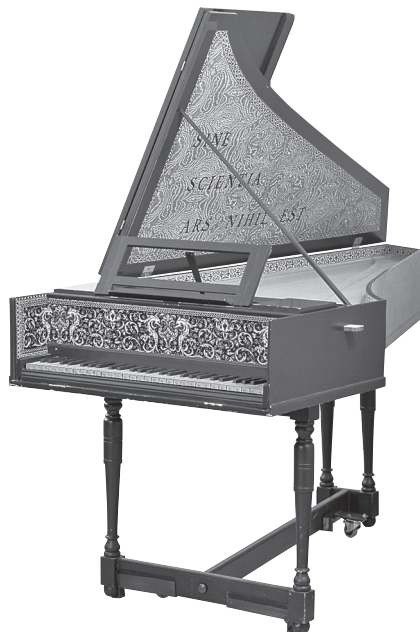
Abbildung 1.4: Ein prächtig verziertes Cembalo

Wenn Sie zufällig einmal ein Cembalo finden – vielleicht in einem Museum –, dann werden Sie bemerken, dass Cembalos wie Flügel aussehen (siehe Abbildung 1.4). Achten Sie jedoch auf den reichverzierten Deckel des Cembalos. Heute müssen Tastenmusiker mit ganz einfachen schwarzen Kisten auskommen.