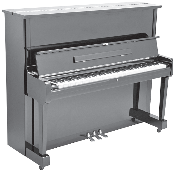
Abbildung 1.2: Aufrecht steht das Klavier