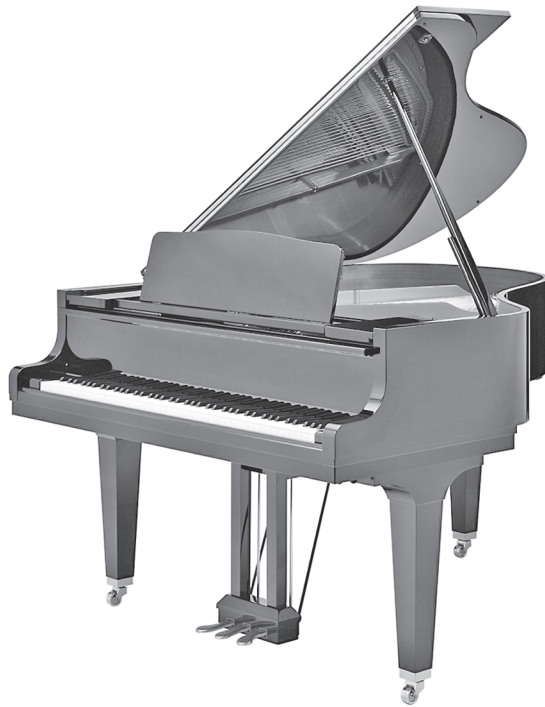
Abbildung 1.1: So einen zu besitzen, ist riesig.