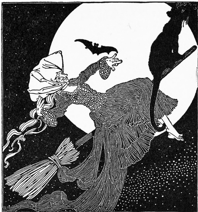
Abbildung 1.1: Eine hübsche Abbildung einer Hexe Dugald Stewart Walker/The New York Public Library/Public Domain

Was auch immer Sie sich vorgestellt haben, es entspricht wahrscheinlich nicht dem tatsächlichen Aussehen der meisten Hexen. Vielleicht haben Sie sich vorgestellt, wie eine Wicca Ihrer Meinung nach aussehen würde. Wicca und Hexerei werden oft verwechselt. Oder vielleicht haben Sie ein Bild heraufbeschworen, das etwa dem in Abbildung 1.1 ähnelt. Obwohl ich einen guten Besen liebe, sehen die meisten Hexen nicht wie das Klischee aus, es sei denn, sie tragen ein Kostüm.