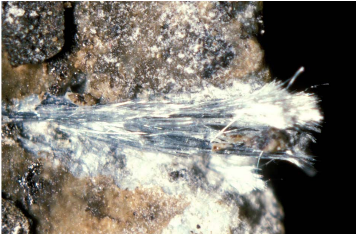
Bild 5.3.20 A: Asbestfasern aus einem bituminierten Asbestzementrohr, 1,7 x 2,5 mm. Die Fasern wurden durch Aufsägen einer Rohrprobe freigelegt.

Die folgenden Bilder geben eine Vorstellung von Asbestfasern und vom Zustand eines unbehandelten Asbestzementrohres nach längerer Betriebsdauer. Zusatzinformation: Drei Bilder zeigen Asbest als Mineral Chrysotil. Hinweis: Bilder eines Asbestzementrohres, in dem calcitübersättigtes Wasser transportiert wurde, findet man in Abschnitt 7.9.7.