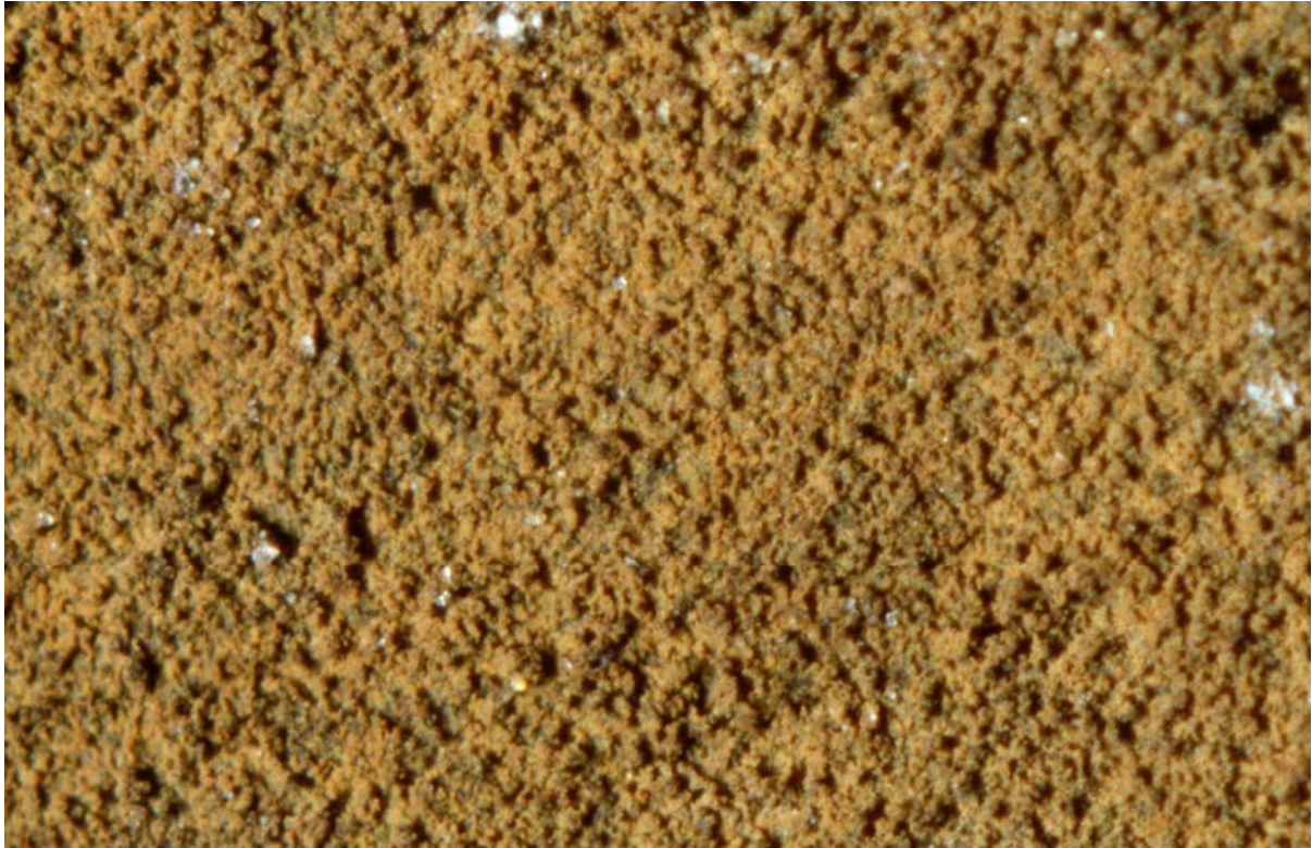
Bild 5.3.20 B: Innenoberfläche eines nicht bituminierten Asbestzementrohres, DN 100, 1,7 x 2,5 mm