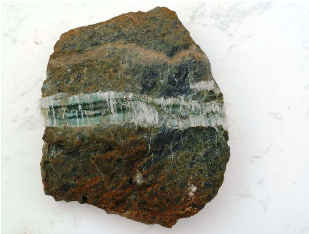
Bild 5.3.20 D: Asbestmineral Chrysotil, Trodos-Gebirge, Zypern, Breite des Asbest-Bandes: ca. 10 mm