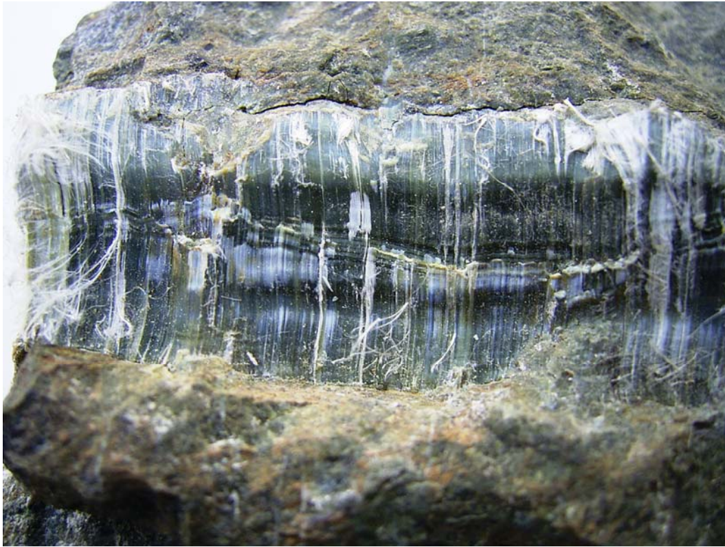
Bild 5.3.20 F: Nahaufnahme des noch weitgehend ungestörten Bereichs des Chrysotils im linken Bereich von Bild D